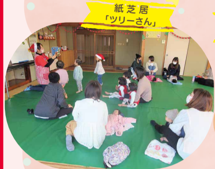
紙芝居 「ツリーさん」