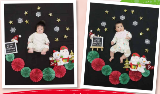
クリスマスのお昼寝アート