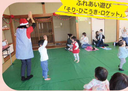
ふれあい遊び 「そり・ひこうき・ロケット」