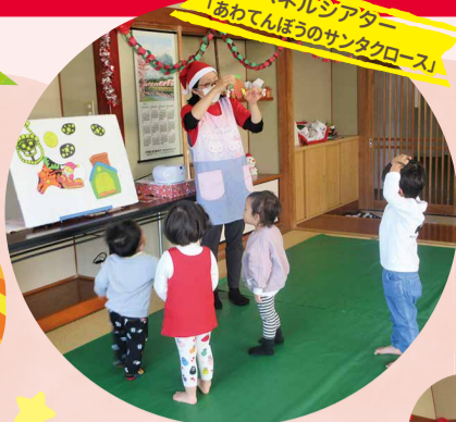
パネルシアター 「あわてんぼうのサンタクロース」