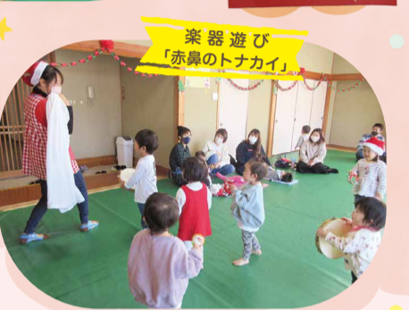
楽器遊び 「赤鼻のトナカイ」