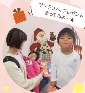
サンタさんプレゼント まってるよ〜★