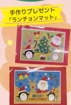
手作りプレゼント 「ランチョンマット」