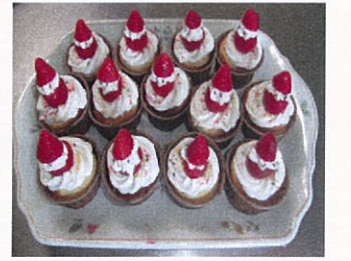
・サンタクロースクリスマスケーキ